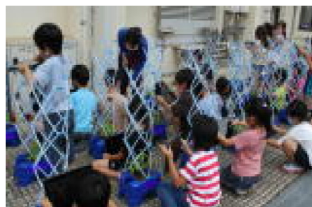
アサガオの観察（1年）