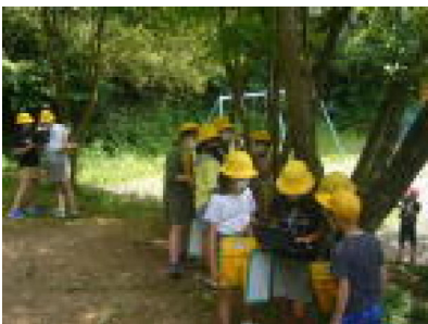
裏山での調べ学習（4年）