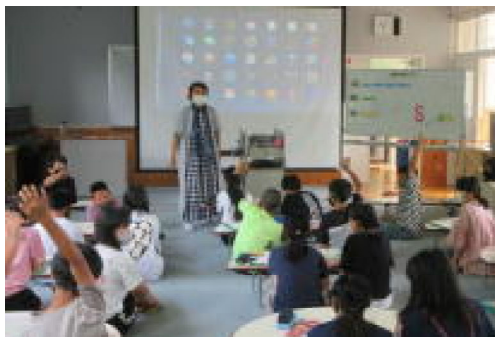
↑ 6年い組 ↓ 6年ろ組と大滝小6年