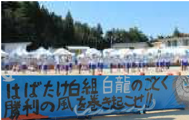
↑白組スローガン (はばたけ白組! 白龍のごとく勝利の風を巻き起こせ!!)