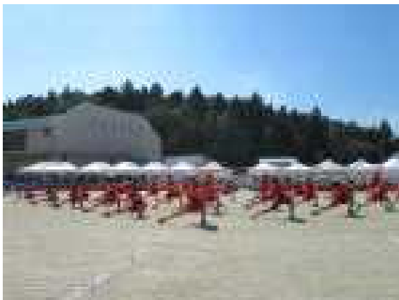
↑合わせよう!心・技・体～南中ソーラン～(中学年部)

「私が運動会でがんばったことはダンスです。みんなと息を合わせて一生懸命におどることができました。終わったときはやりきれたという達成感がありました。たくさん練習してきた良かったです。」(2年)