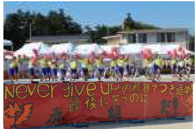
↑赤組スローガン (Never give upの精神でつき進め! 最後に笑うのは赤組だ!)

爽やかな秋晴れの下、子どもたちが楽しみにしていた運動会が開催されました。開会式の後、赤組・白組に分かれ、6年生によるエール交換が行われました。どちらもアイデア満載の動きが揃ったダンスでエールを送りました。まずは、徒競走から始まり、一人ひとりが全力を出してゴール目指して走りました。学年ごとに全員リレーや障害物競走などの団体競技が行われ、各チームで力を合わせました。各学年部の練習で一番時間をかけて取り組んできた団体演技では、全員が気持ちを一つにして素晴らしい演技を披露しました。会場からも息の合った演技にたくさんの拍手をいただきました。