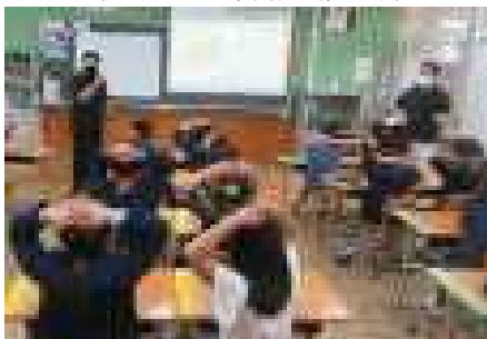
↓シャハ先生と外国語活動の授業