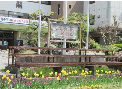
↑ 言の葉花壇に咲くチューリップ

今年度も「学び合い、助け合い、高め合える多賀小学校」になるように、上記の教育目標に向かって、知・徳・体のバランスがとれた心身共にたくましい子どもの育成をめざして日々の教育活動を進めてまいります。そのためには、①「わかった」「できた」という喜びを感じられる楽しい授業を展開し、学び合いを通して課題を解決し、達成感を味わえるようにすること、②思いやりを持ち、互いに助け合い、日々感謝の気持ちを大切にでき、一人ひとりが大切にされているという実感が持てるようにすること、③心身ともにたくましく、健やかに成長するためにも、気持ちの良いあいさつをかわすことで、良い人間関係を築き、互いに高め合えるようにすることに取り組みます。