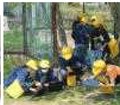
↑タブレットを使って理科観察授業